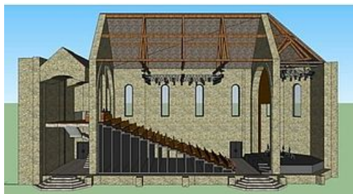
Illustration 3D du projet de chapelle auditorium

Sur une surface d' environ 1 600 m 2 , ce sont 39 salles avec un principe de polyvalence et de mutualisation dont 1 grande salle d'orchestre, 2 studios de percussions, 1 salle de musique assistée par ordinateur, 3 salles de répétitions qui seront accessibles grâce à un large hall aux usages multiples notamment l'accueil adapté des élèves, des enfants et de leurs parents, la mise à disposition de casiers à instruments, l'accès à un espace de ressources culturelles (livres, partitions, magazines, supports numériques...).