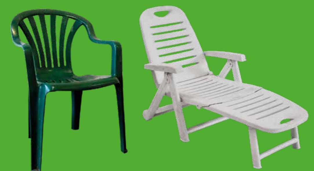
MOBILIER DE JARDIN