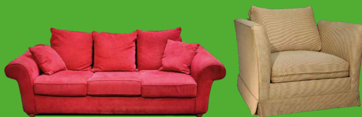
SIÈGES ET CANAPÉS