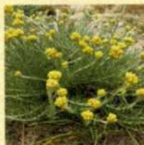
Immortelle des dunes