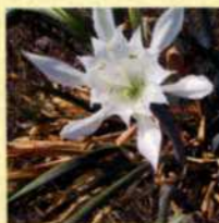
Lys de mer (protection régionale)