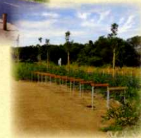
Parking à vélos de Lanclay