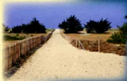
Accès à la plage et mise en défens de la dune