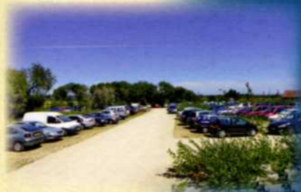
Parking de Lanclay