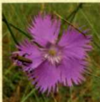
Œillet des dunes (protection nationale)