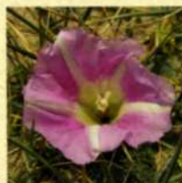
Liseron des dunes