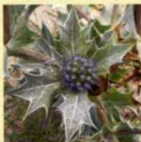
Chardon des dunes