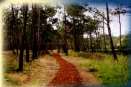
Traversée de la forêt de pins